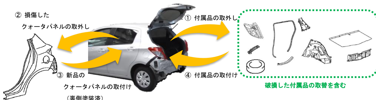
図2 B270 クォータパネル取替作業のイメージ

なお、塗装に関する作業は表側、裏側共に補修塗装指数の範囲としているため、クォータパネル取替には含んでおりません。