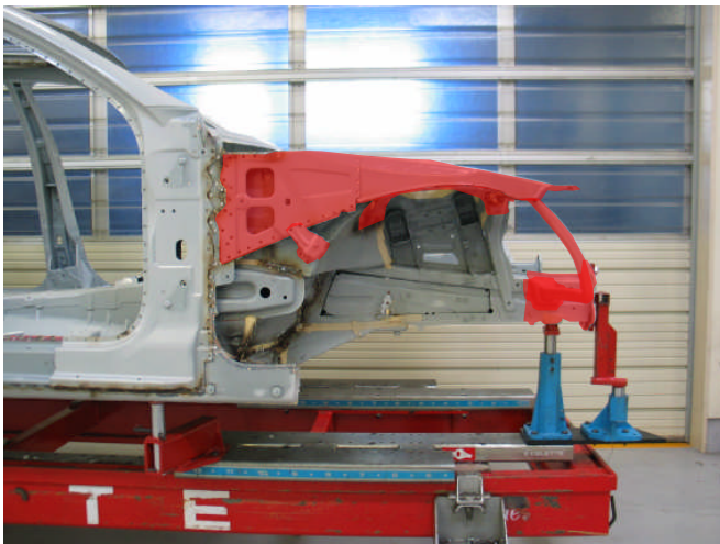
【片側ホイールハウスコネクション、片側トップサイドメンバ、片側フロントセクションリペアサイドメンバ半裁取替】